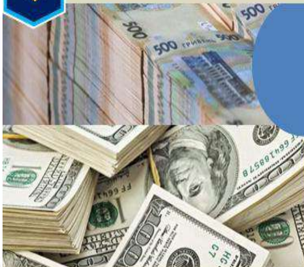
ІНФОРМАЦІЯ ЩОДО ГРОШОВОГО АКТИВУ