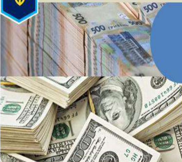
ІНФОРМАЦІЯ ЩОДО ГРОШОВОГО АКТИВУ